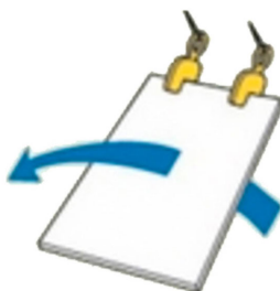
Vertical lifting of steel structures / Izaje vertical de estructuras de acero