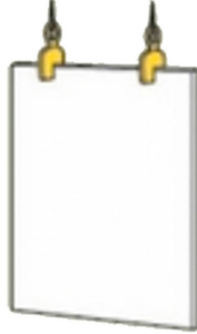
Turning-over of steel plates/ Cambio de cara de láminas de acero