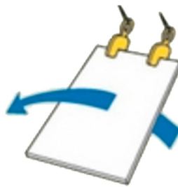
Vertical lifting of steel structures / Izaje vertical de estructuras de acero