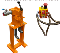
Mando con Parada de Emergencia Separados del Winche (5 metros)