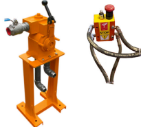
Mando con Parada de Emergencia Separados del Winche (5 metros)